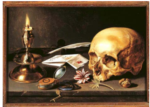
Figura 4. Pieter Claeszoon, Vanitas , 1625.