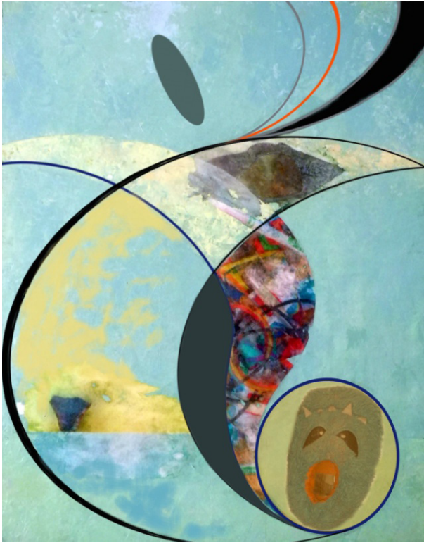
Figura 5. Aurora Alcaide Ramírez, (Des)encuentro I , 2013. Técnica mixta sobre madera, 90x70 cm.