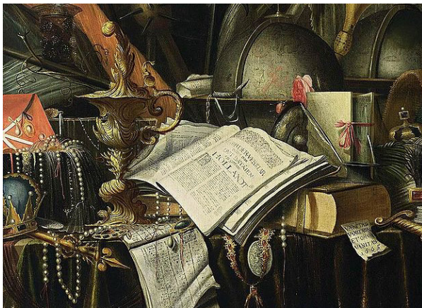
Figura 3. Evert Collier, Vanitas , 1665.

Alberto Ruiz de Samaniego afirma en este sentido que “la naturaleza muerta se correspondería con ese simbolismo peculiarmente equívoco de la tragedia más o menos inminente que subyace siempre en toda belleza”. 15 Esta idea de Belleza como trampantojo, como antesala de la fatalidad, es aplicada a las obras que integran el proyecto Vanitas de la crisis o el (des)encuentro con el Otro , de ahí que la apariencia final de la mayoría de ellas se corresponda con cierto canon de belleza; rasgo que potencia el