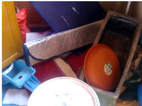
Figura 2. Ejemplo de bodegón caracterizado por el caos. Fotografía realizada en una casa que acababa de ser desahuciada.

En el ensayo La poética del espacio , el filósofo francés Gaston Bachelard reflexiona sobre esta noción, señalando que “la casa vivida no es una caja inerte. El espacio habitado trasciende el espacio geométrico”. 9 Entendida en este sentido, la casa adquiere características opuestas; por un lado es “maternidad”, “protección”, “refugio”, “fortaleza”, “estabilidad” y “espacio de consuelo e intimidad” (espacio privado). Pero por otro es “expansión” y “universo”, “es celda pero también mundo” (espacio público). 10 En opinión de este autor, “en todo sueño de casa hay una inmensa casa cósmica en potencia. De su centro irradian los vientos, y las gaviotas salen de sus ventanas. Una casa tan dinámica permite al poeta habitar el universo. O, dicho de otra manera, el universo viene a habitar su casa”. 11 Para Gaston Bachelard, por tanto, la casa vivida es un espacio