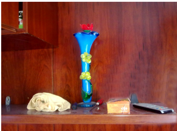
Figura 1. Ejemplo de bodegón en donde reina el orden. Fotografía realizada en una casa que acababa de ser desahuciada.

¿Qué hacer con los restos del Otro? Esta pregunta es el punto de partida del proyecto artístico Vanitas de la crisis o el (des)encuentro con el Otro, un proyecto autobiográfico que profundiza en el dilema apuntado por García Canclini que se ha recogido al inicio de este apartado: ¿qué hacer? ¿Eliminar rápida y radicalmente las pertenencias y los rastros del Otro o buscar la manera de convivir con él, esforzarnos por conocerlo, para que cada vez nos resulte menos ajeno?